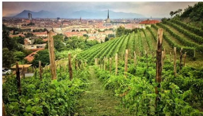
La Vigna della Regina, sulla collina torinese

Torino consacra il mese di ottobre all'uva e al vino. Dal 19 al 21 è in programma, nelle zone auliche della città, Vendemmia a Torino - Grapes in town, la kermesse promossa dalla Regione e realizzata in collaborazione con il Comune, che propone degustazioni, convegni e percorsi culturali a tema, tra musica e arte. Una seconda edizione che si prospetta molto più ricca rispetto alla prima stagione, con anche un giorno in più di programmazione.